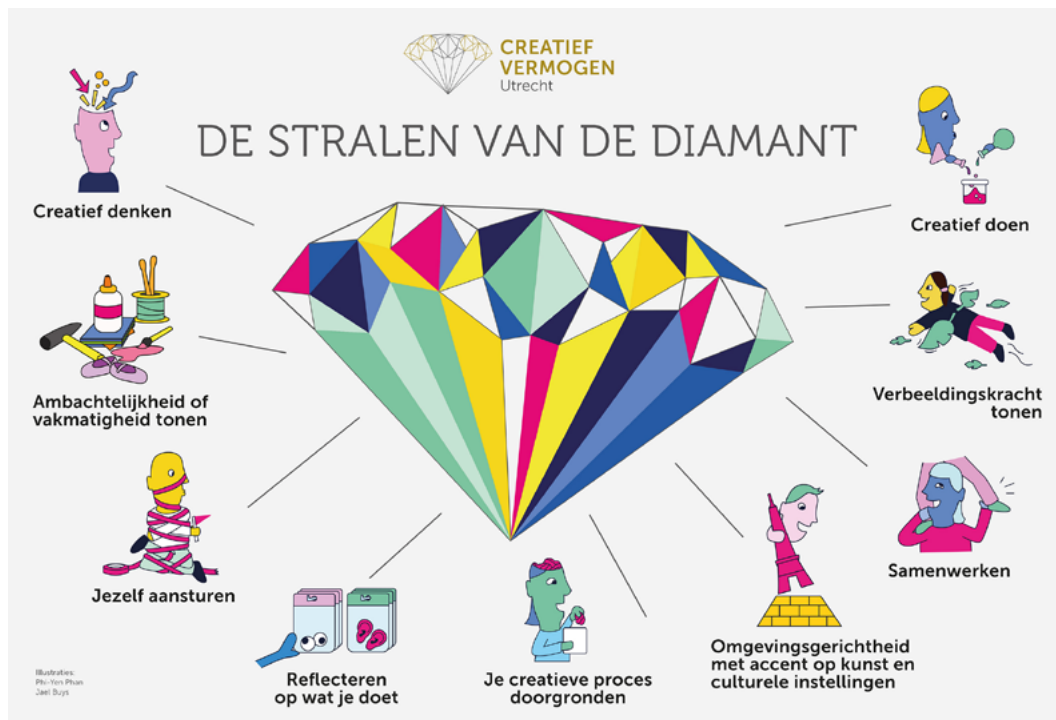
De stralen van de Diamant - HKU